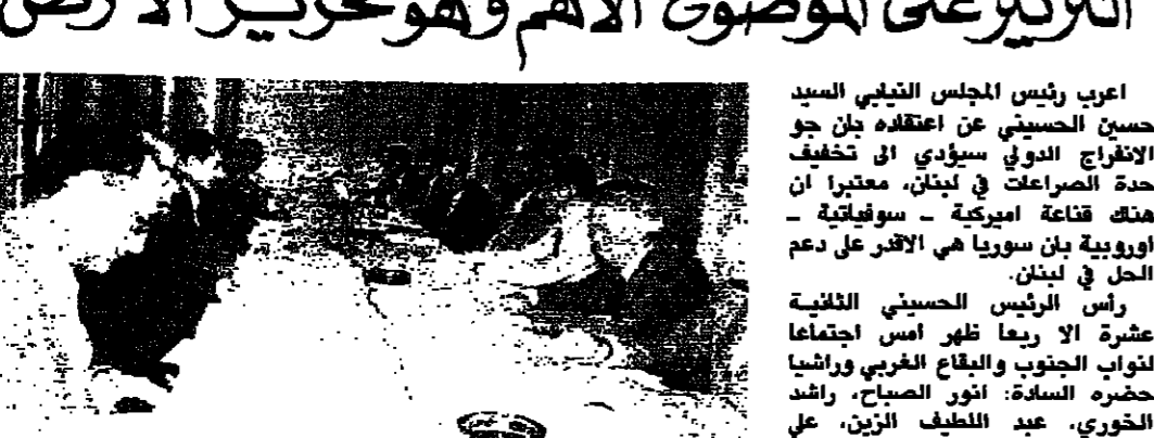
الرئيس الحسيني ترستنا الاجتماع الخبيسي (دائلي وشيرا)

أعرب رئيس المجلس اللبناني السيد حسين الحسيني عن اعتقاده بأن جو الانفتاح الدولي سيؤدي إلى تخفيف حدة الصراع في لبنان، معتبراً أن هناك قاعة دولية - سوفييتية - أوروبية بأن سوريا هي الأقدر على دعم الحل في لبنان، وهناك انصراف إسرائيل عن مركزية قوية من تسهيل أعمال المواطنين عبر ما اصطلح على تسميته بالمشروع. واعتقد الحسيني أن الحل في لبنان، وهناك انصراف إسرائيل عن مركزية قوية من تسهيل أعمال المواطنين عبر ما اصطلح على تسميته بالمشروع. واعتقد الحسيني أن الحل في لبنان، وهناك انصراف إسرائيل عن مركزية قوية من تسهيل أعمال المواطنين عبر ما اصطلح على تسميته بالمشروع.